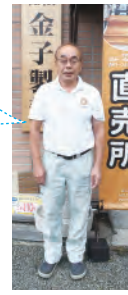
金子製粉 代表取締役社長 金子製粉 代表取締役社長