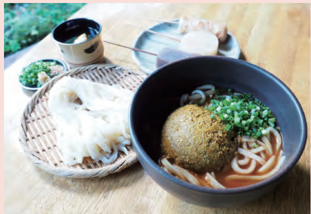
写真右下から＝名物の「カレーうどん」(970円)、うどんのコシを実感できる「ザルうどん」(520円)、セルフサービスのおでん(1本140円)。いずれも税込。

南足柄市 足柄古道 万葉うどん バスの終着駅でもある地蔵堂から徒歩1分。うどんや出汁の味を左右する水は、夕日の滝近くから湧き出る「金太郎の力水」を使用しています。ちよびりスパイシーなカレーうどんは、うま味が凝縮したドライカレーとトマト風味の出汁とよく絡ませ、ふと茅葺屋根の趣ある店内を見渡せば、そば湯ならぬ、ゆで湯あります。の貼り紙が、店主に伺うと「自然素材を贅沢に使った出汁をゆで湯とともに楽しんでほしい」とのこと。出汁への自信を感じます。